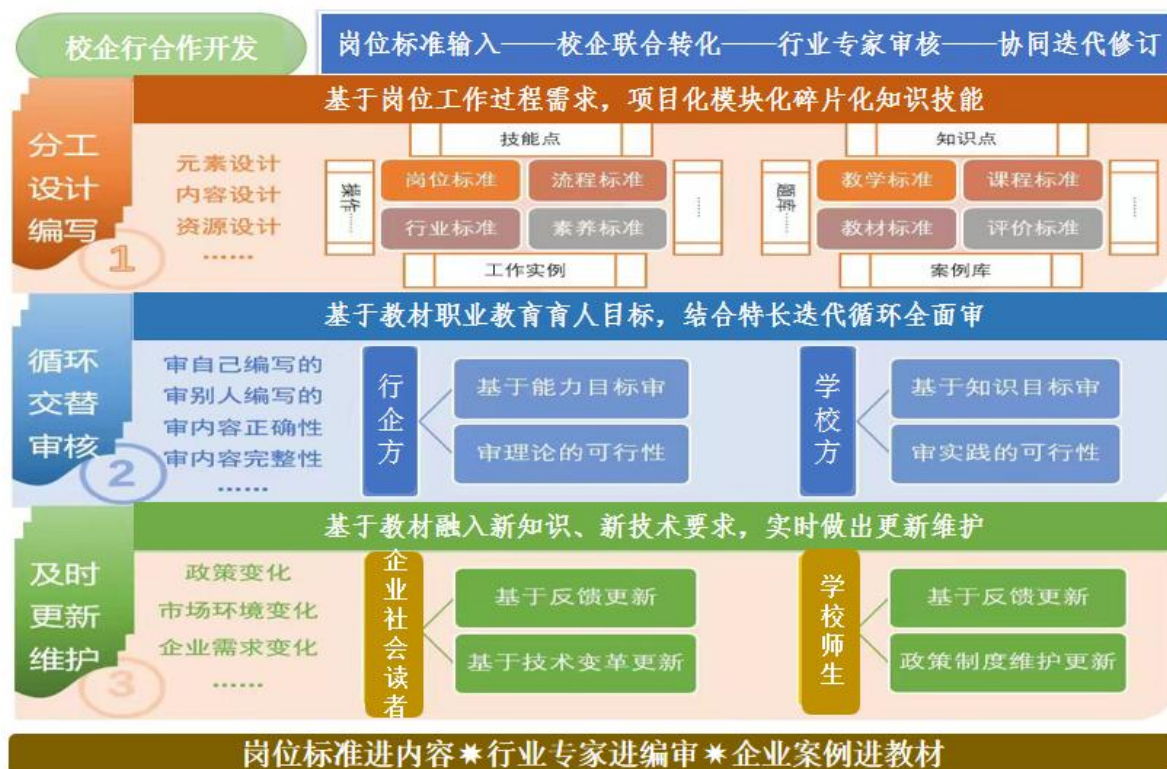
图 2 校企行三方协同共建共审共维护教材的三进模式