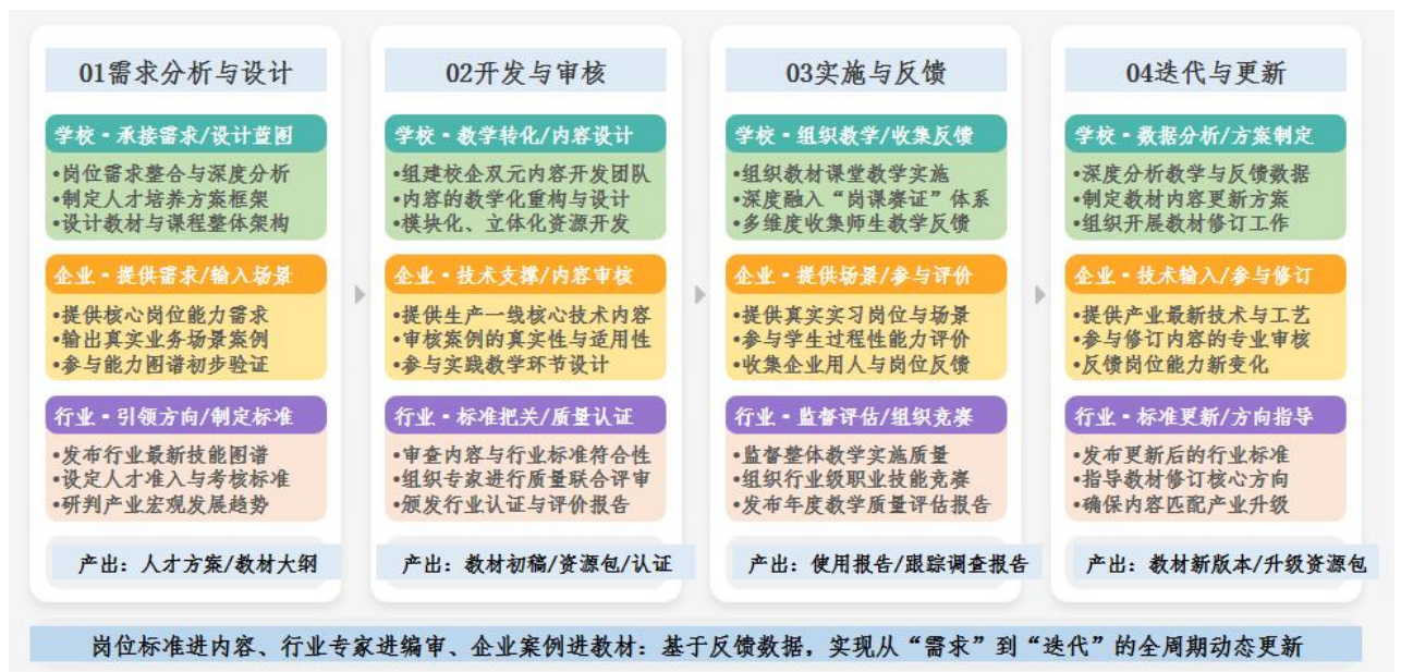
图3 校企行三方协同材课联动建设迭代路径图