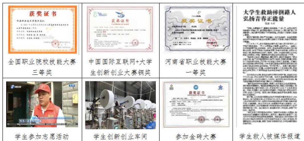
图 6 学生在校期间获得荣誉图

成果以校企协同开发的优质教材为载体，通过将企业岗位标准、行业真实案例、数字化技能要求融入教材全内容，学生在掌握财经专业核心知识的同时，实操能力、岗位适配度与职业素养全面提升。近年来，学生在全国职业技能大赛、全国财经赛道赛事、全国创新创业大赛中斩获国家级奖项 5 次，省级技能大赛获奖超 10 次；毕业生就业率、专业对口率持续保持高位，深受合作企业与行业用人单位的高度认可，真正实现了以优质教材育高素质人才的育人目标。