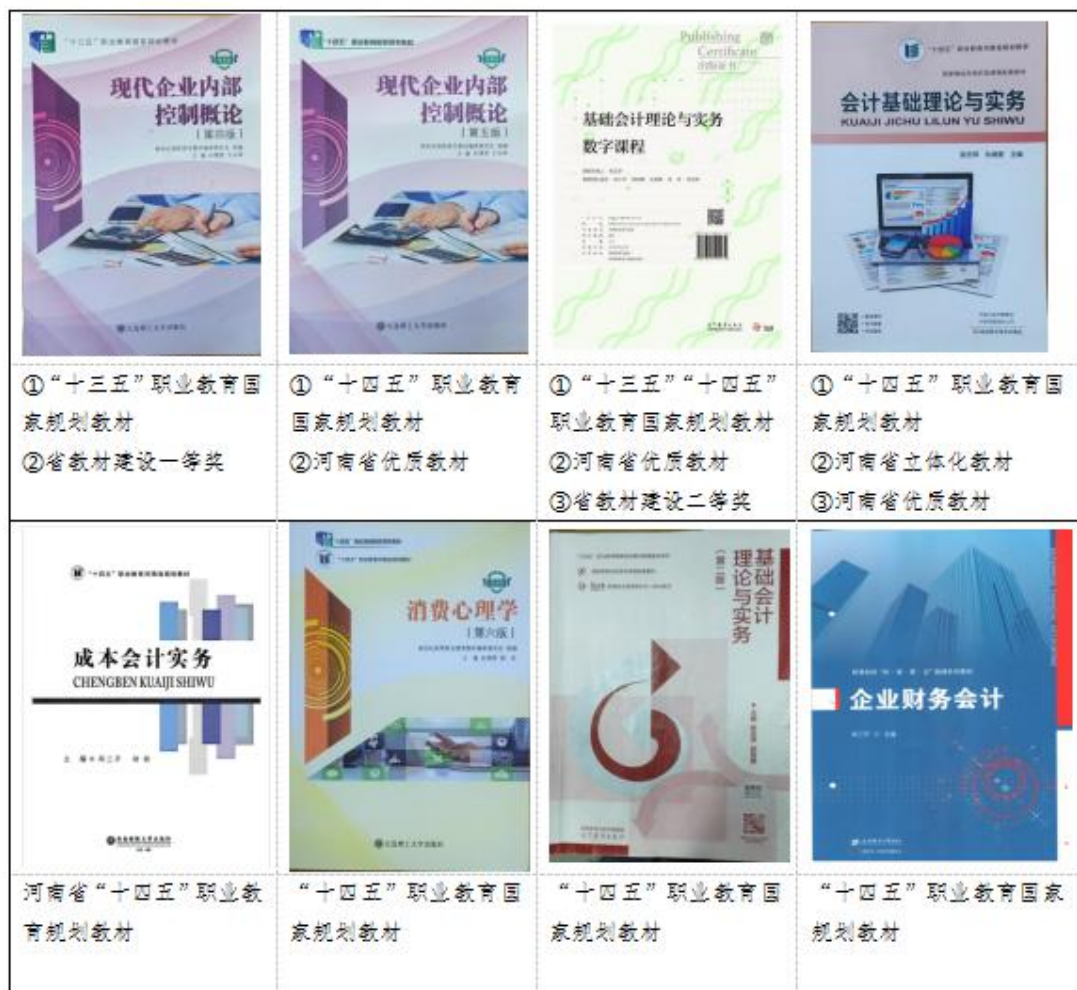
图 5 教材建设成果图